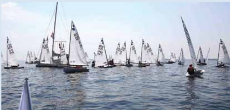
Europajoller venter på vind ved SE.