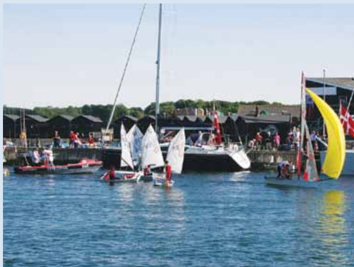
Optimister og 29'