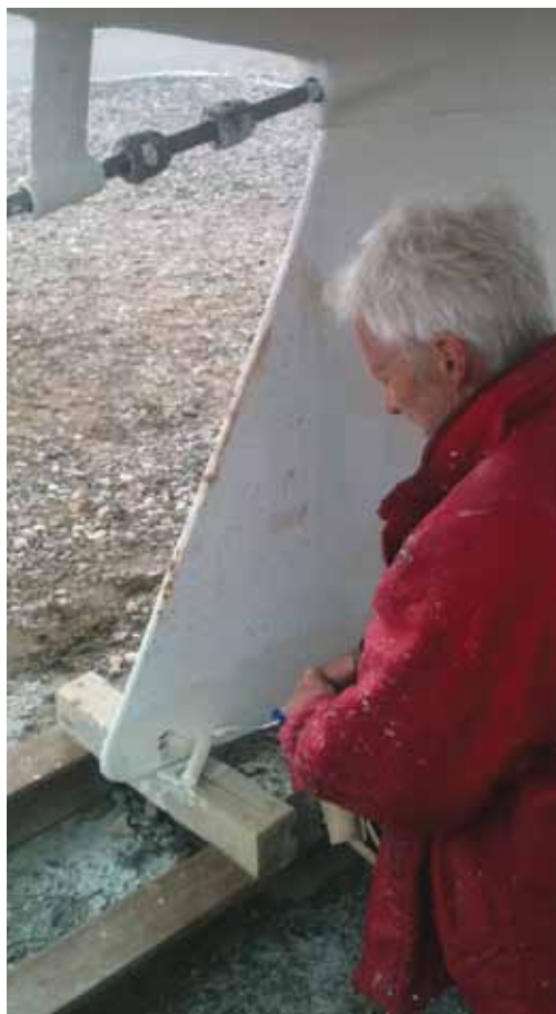
Lidt hvid maling pynter altid.

Marinaen begynder så småt at ligne sig selv; der kommer flere og flere både i vandet, men vender man sig om og kigger på landdelen af vores havn er det meget tydeligt at rigtig mange er kommet utrolig sent i gang med klar- gøring og søsætning. Jeg har som sædvanlig en god undskyldning når tingene går mindre hurtigt. I år hedder den ”ny motor”. Den ligger